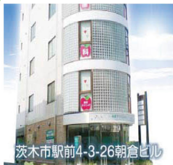
茨木市駅前4-3-26朝倉ビル

いい(11)歯(8)の日に歯の正しい知識を普及啓発し、歯科疾患を予防する習慣の定着を図って健康の保持と増進を目的としています。この運動は、厚生省、日本歯科医師会が推進しており『80歳になっても20本の自分の歯を残そう』という『8020運動』に繋がっています。